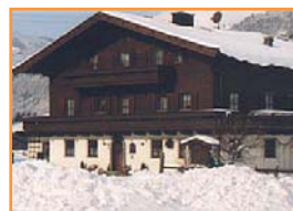
TURISMO RURAL MITTERSILL ○○○

Casas particulares que alquilan habitaciones con baño privado y desayuno incluido, situadas en Mittersill y alrededores a unos 5 Km. de remontes.