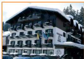
HOTEL MIRAMONTI ○○○○○

Uno de los mejores con muy buenos servicios, centro wellness con piscina y una situación ideal en el centro y junto la pista 3-Tre. www.miramontihotel.com