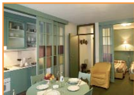
RESIDENCE ANTARES ○○○○

Buenos apartamentos totalmente equipados, ideales para 3-4 personas. Situación ideal en el centro y junto la pista 3-Tre. www.residenceantares.com